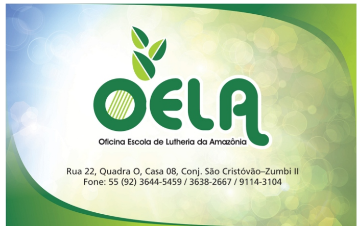
Placa da fachada