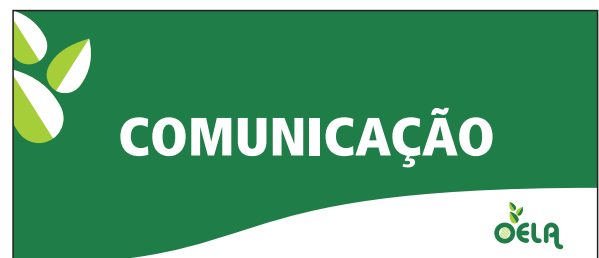
Placa de identificação